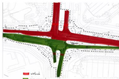
Figuur 2: Afsluiting zijde kruising Engelendaal