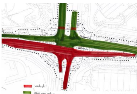
Figuur 1: Afsluiting zijde kruising Simon Smitweg

Zodra de werkzaamheden aan de zuidwestzijde zijn afgerond, wordt het werk voortgezet aan de zijde van Engelendaal van de kruising van woensdag 7 maart t/m donderdag 22 maart 2018 . Ook dit gedeelte van de kruising wordt afgesloten voor verkeer (zie figuur 2). Ook in deze situatie wordt het verkeer vanaf de kant van Leiden en vanaf Leiderdorp centrum omgeleid.