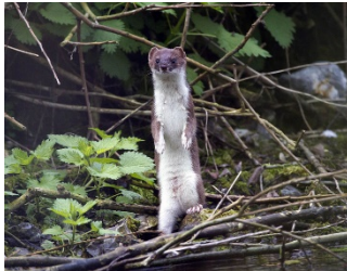
2 Hermelijn